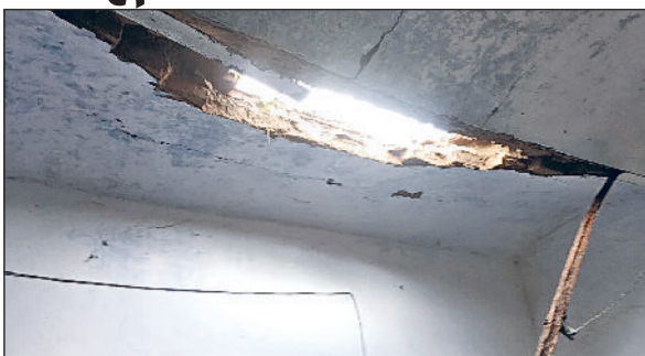
सिरसा। गांव रूपावास का जर्जर हो चुका स्कूल का कमरा।

■ स्कूल में जर्जर हालत में 9 कमरे, एक कमरे की बारिश से छत गिरी, खुले आसमान और शैड के नीचे बैठकर पढ़ना मजबूरी