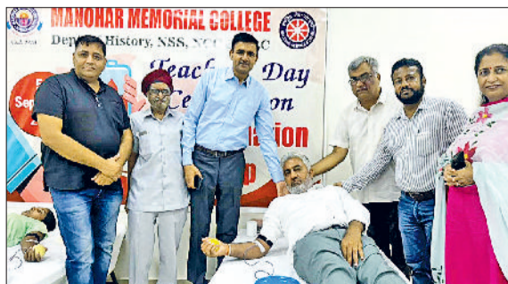
फतेहाबाद। एमएम कॉलेज में रक्तदाताओं को प्रोत्साहित करते प्राचार्य।