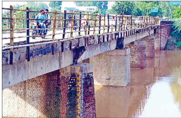
फतेहाबाद। जिले से गुजर ही घग्गर नदी।

बारिश के कारण एक मकान की छत गिर गई हरिभूमि न्यूज ▶ फतेहाबाद