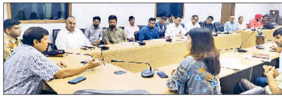
सिरसा। अधिकारियों के साथ बैठक करते एडीसी।

उन्होंने ड्यूटी पर तैनात अधिकारियों को तटबंधों की मजबूती और सुरक्षा से संबंधित आवश्यक दिशा-निर्देश दिए। बिजली व्यवस्था और अन्य जरूरी संसाधनों की उपलब्धता की जानकारी ली गई और समय पर व्यवस्था करने के निर्देश दिए गए।