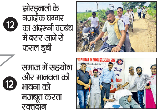
झोरइनाली के नजदीक घग्गर का अंदरूनी तटबंध में दरार आने से फसल डूबी समाज में सहयोग और मानवता की भावना को मजबूत करता रवतदान

भूना में जलनिकासी में लग सकता है एक सप्ताह का समय, रिश्तेदारों के घर पलायन कर रहे लोग