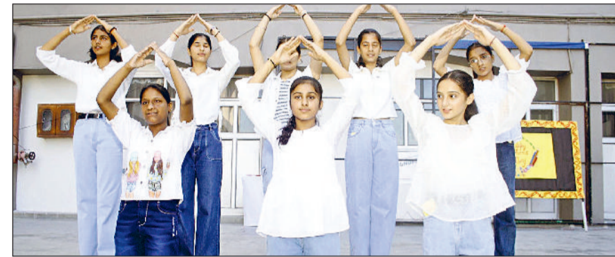
फतेहाबाद। क्रेसण्ट स्कूल में शिक्षक दिवस पर प्रस्तुति देती छात्राएं।