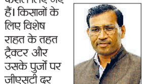
हरिभूमि न्यूज। सिरसा