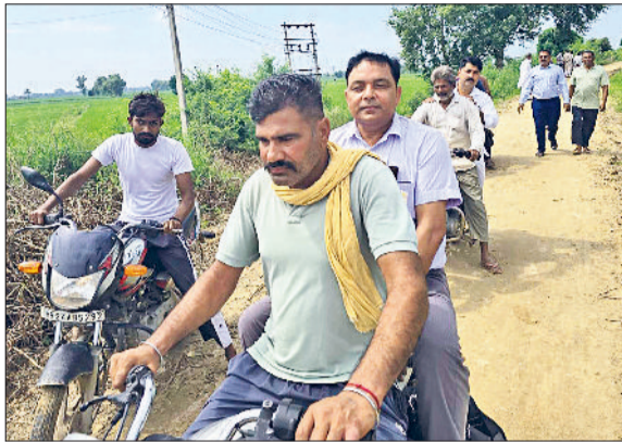
सिरसा। मोटरसाइकिल पर घग्गर के तटबंधों का जायजा लेते अधिकारी।

क्षेत्र से गुजर रही घग्गर नदी के बढ़ते जलस्तर ने जिलावासियों की धड़कनें बढ़ा दी हैं। पिछले चार दिनों से हर रोज घग्गर में पानी की बढ़ती हुई गति है। शुक्रवार को झोरड़नाली के नजदीक घग्गर के अंदरूनी तटबंध में दरार आने से कई एकड़ फसल डूब गई। केलनियां को आने वाले रास्ते पर भी पानी भर गया और आवागमन बंद हो गया। बढ़ रहे पानी के स्तर को देखते हुए प्रशासन के साथ-साथ ग्रामीण भी तटबंधों को मजबूत करने में लगे हुए हैं। जिला प्रशासन और सिंचाई विभाग की टीमों 24 घंटे घग्गर नदी के तटबंधों की निगरानी और मजबूती में जुटी हैं। एहतियात के तौर पर तटबंधों को लगातार और मजबूत किया जा रहा है। ट्रैक्टर, जेसीबी, पोकलेन आदि की सहायता से तटबंधों पर मिट्टी डलवाई जा रही है। इसके अलावा मनरेगा के माध्यम से मिट्टी के कट्टों को भरवाई की जा रही है। प्रशासनिक अधिकारी लगातार दिन और रात तटबंधों का निरीक्षण कर हर स्थिति का जायजा ले रहे हैं और जहां किसी संसाधन की आवश्यकता है, उसकी भी पुख्ता व्यवस्था सुनिश्चित कर रहे हैं। वहीं