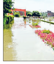
भूना। दाणी सांचला-भोजराज रोड पर अब भी तीन फुट पानी में डूबा हुआ न्यू सनराइज सीनियर सेकेंडरी स्कूल।