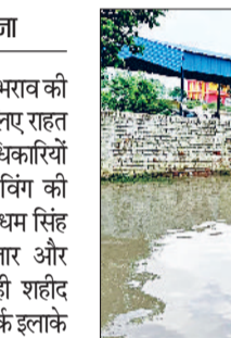
भूना। दाणी सांचला-भोजराज रोड पर जलभराव में फंसा हुआ मोटरसाइकिल चालक।

हिसार रोड स्थित अग्रसेन चौक से लेकर बीएसएनएल टेलीफोन एक्सचेंज तक के हिस्से में अब भी तीन फुट से ज्यादा पानी खड़ा है। मांडल डाउन, चंदन नगर, वार्ड नंबर 11, धमीजा कॉलोनी, श्याम विहार, मातृगाम कॉलोनी और दाणी सांचला-भोजराज रोड जैसे क्षेत्रों में