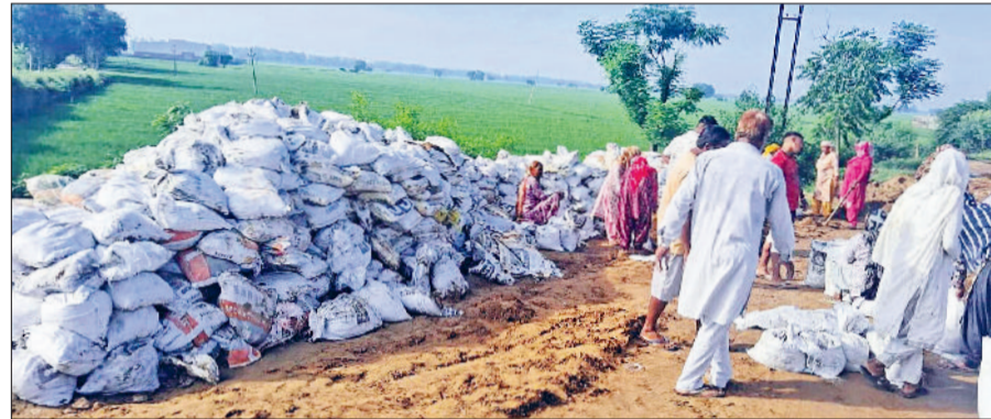
टोहाना। घग्गर किनारे रिग बांधों की मजबूती के काम में जुटे मजदूर।