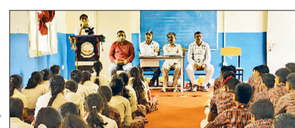
सिरसा। नशामुक्ति जागरूकता शिविर में भाग लेते विद्यार्थी।