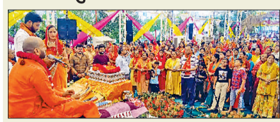
सिरसा। कथा के दौरान पूजा-अर्चना करते श्रद्धालु।

सिरसा। शुकल भारतीय धर्मसमा के तत्वावधान में श्री मद्भगवत कथा का आयोजन अखिल कुशल, पर्यावरण के अनुकूल और सुविधाजनक बनाने में हमारी मदद कर सकता है। यह मॉडल ऊष्मा स्थानांतरण के सिद्धांत पर काम करता है, मुख्यतः चालन, संवहन और विकिरण। तंदूर लकड़ी या चारकोल का उपयोग करते उच्च ताप उत्पन्न करता है, जिससे भोजन सभी तरफ से क्षमता रूप से पकता है। मॉडल का बाहरी भाग मोटी इन्सुलेटेड शीट से बना है, जो इसकी गर्मी को बरकरार रखता है और बेलनाकार आकार इसकी गर्मी को समान रूप से वितरित करने में मदद करता है। यहां एक कार्बनबॉक्स है, जहां हम लकड़ी, कोयला आदि डाल सकते हैं और नीचे राख डकड़ करके ले लिए राखदान है। हमने इसके उपरी ढक्कन पर धिक्की मिट्टी की एक परत लगाई है। इससे हम चापाती को धिक्का सकते हैं और पकने तक ढक्कन बंद कर सकते हैं। इससे हथ जलने से भी बचेगे।