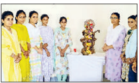
फतेहाबाद। शिक्षक दिवस कार्यक्रम का शुभारंभ करते हुए प्रचार्या।